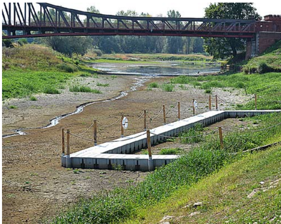
Tak wygląda Port Ścinawa. Obecnie to suchy port

w 13 lipca 1997 roku w Ścinawie wody było 733 cm! Port Ścinawa to obecnie suchy port. Woda jest tylko w wejściu do tego miejsca.