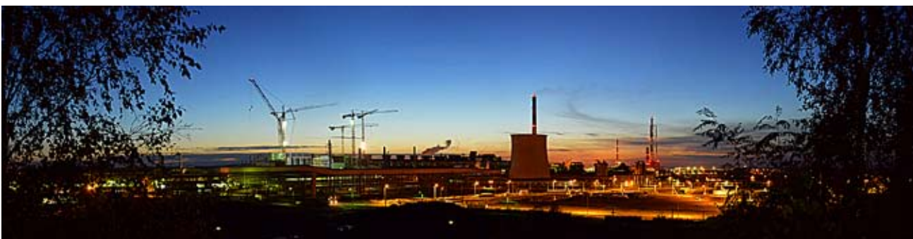
Dźwigi na budowie nowego pieca zawieszinowego w Hucie Miedzi Głogów

Tradycyjnie program obchodów Dnia Hutnika przygotowały także poszczególne hutnicze Oddziały KGHM. Zaplanowano m.in. festyny rekreacyjne, rozgrywki sportowe, rajdy piesze i samochodowe a także wielobój BHP i PPOŻ.