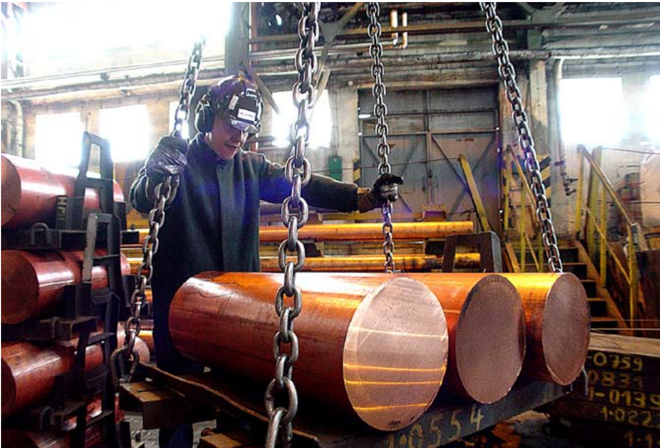
Wlewiki produkowane są tylko w Hucie Miedzi Legnica

Polska Miedź chce zwiększyć odzysk pierwiastków towarzyszących produkcji miedzi. To opłacalny biznes. Przykładem niech będzie złoto, srebro, a także niezwykle cenny w lotnictwie ren, w którego przypadku KGHM jest pierwszej trójce światowych producentów tego pierwiastka.