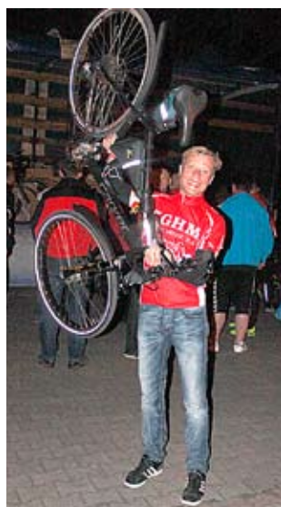
Przejechali przeszło 400 km, zarejestrowali ponad 50 dawców szpiku,

Sportowcy z Miedziowego Towarzystwa Sportowego, pojechali na rowerach z Lubina do Kołobrzegu. Podróż „Rowerem po szpik” zakończyła się w niedzielny wieczór.