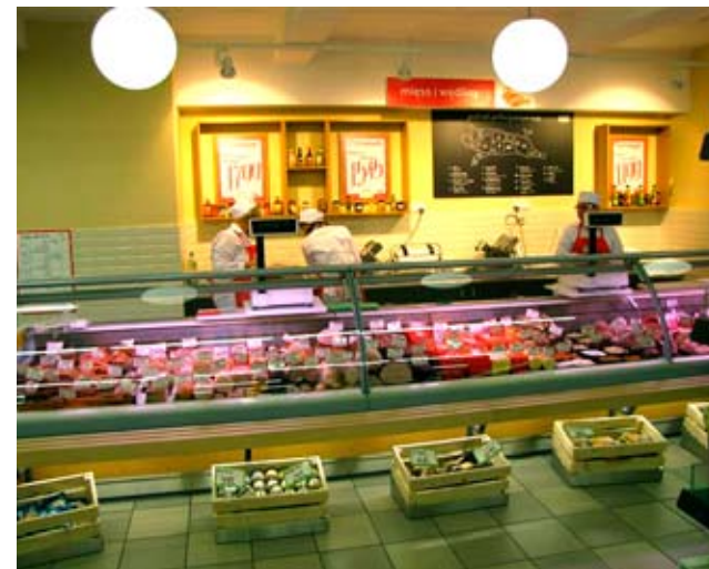
Delikatesy Centrum Poniedziałek-sobota: 7-21, niedziela: 8-18

- Na tydzień i co dzień - Delikatesy Centrum