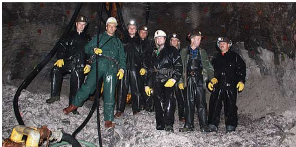
Załoga szybowa SW-4

70 tys. metrów sześciennych powietrza na minutę to docelowa wydajność szybu wentylacyjnego wdechowego SW-4. W ubiegłym tygodniu nastąpiło zbitie techniczne trzydziestego szybu realizowanego przez Przedsiębiorstwo Budowy Kopalń PeBeKa.