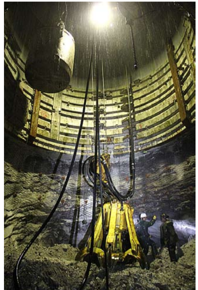
Głębienie szybu w obudowie betonowej nad solą kamienną, poziom 1015 m

Ostatnim etapem, po dokonaniu zbitcia szybu z wyrobiskami poziomymi kopalni, na poziomie 1.209 m, będzie wykonanie wlotów wentylacyjnych oraz rząpia wraz z korkiem szybu. Prace te zostaną zakończone do października br.