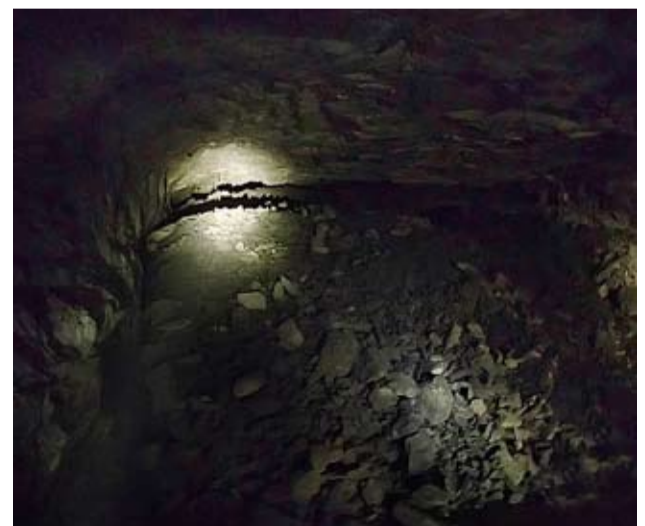
Podszybie SW-4 (upadowa F-9 z lunety wentylacyjnej).