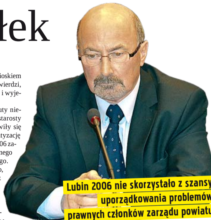
Lubin 2006 nie skorzystało z szansy uporządkowania problemów prawnych członków zarządu powiatu

Wczorajsze głosowanie zakończone dzięki kolegom starosty na jego korzyść nie zamyka sprawy przyczyn wniosku o odwołanie starosty. Swoją procedurę zmie-