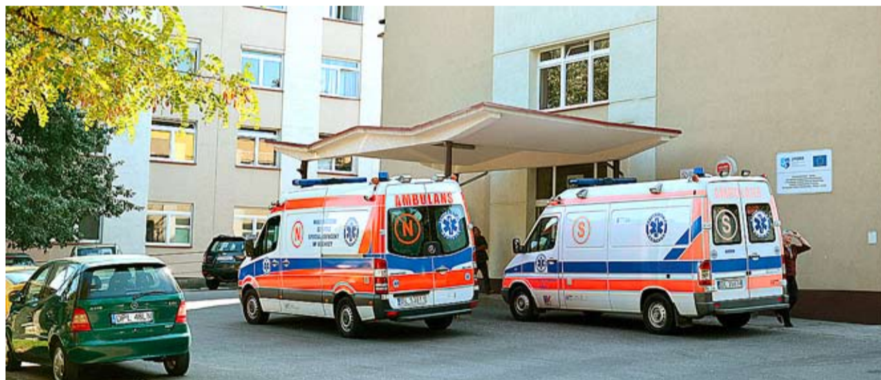
Kierowany przez Adama Myrdę powiat, z powodu prywatyzacji szpitala, rezygnuje z niemal 7 mln zł dotacji.