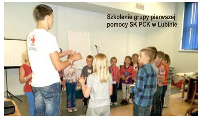
Szkolenie grupy pierwszej pomocy SK PCK w Lubinie

Poprowadzą go Społeczni Instruktorzy Młodzieży działający przy Oddziale Rejonowym PCK w Lubinie.